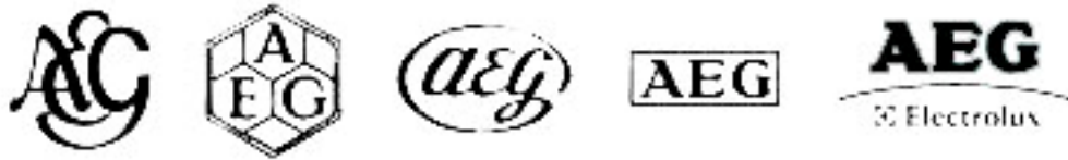
圖 1-1 德國「AEG」電器公司商標發展過程 (置中對齊)